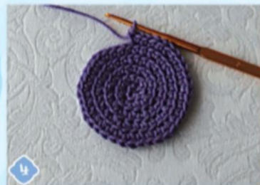
4 2-й ряд — увеличиваем количество столбиков вдвое: на каждой петле вызываем по 2 СБН (16 столбиков).