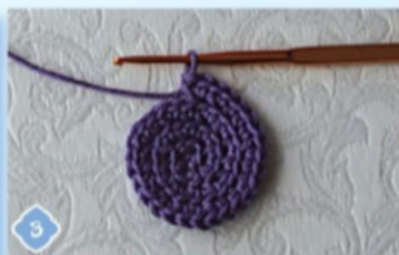
3 1-й ряд — увеличиваем количество столбиков вдвое: на каждой петле предыдущего ряда вызываем по 2 СБН (8 столбиков).