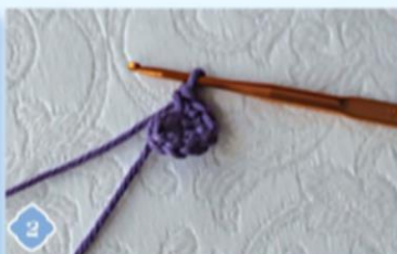
2 Делаем 1 ВП и вяжем по кругу по спирали СБН.