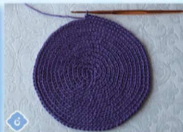
6 4-й ряд — чередуем: 2 СБН, СБН, СБН, 2 СБН.