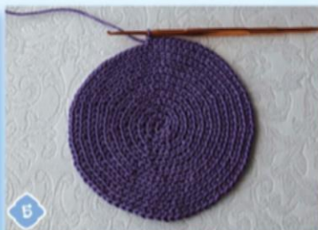
5 3-й ряд — чередуем СБН и 2 СБН, например: 2 СБН, СБН, СБН, 2 СБН.