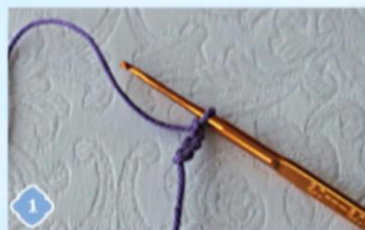
1 Яблоко. Вязем 4 ВП и соединяем их в кольцо ПСБН.

Конечно, можно эти небольшие образцы распускать и вязать новые. Но даже начинающим мастерицам так хочется увидеть какой-то результат своего труда! Поэтому предлагаем из небольших образцов собрать яркие осенние подставки под чашки в виде фруктов. Такую красоту и подарить можно! И тогда осенние чаепития станут ещё уютнее!